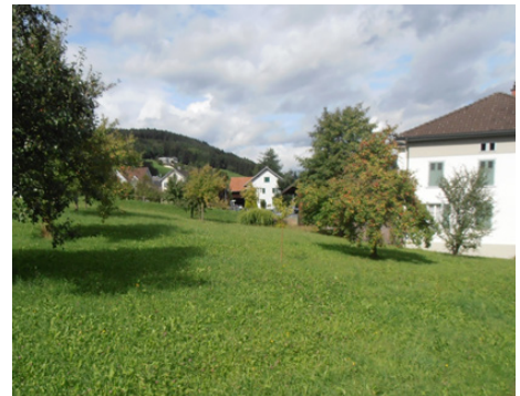
Die wunderschöne Pfarrbündt

Unter der Leitung von Helmut Sonderegger wurde vor 1,5 Jahren die Gruppe Schauplatz Obst und Garten gegründet.